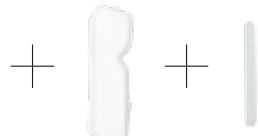
サムスパイカ専用 ギブスシーネ