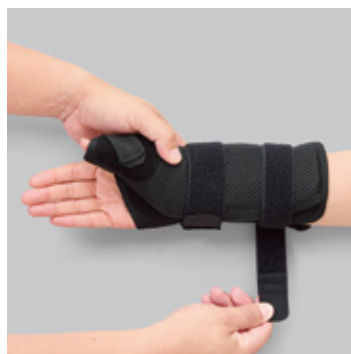
各種ストラップ、 面ファスナーをとめる